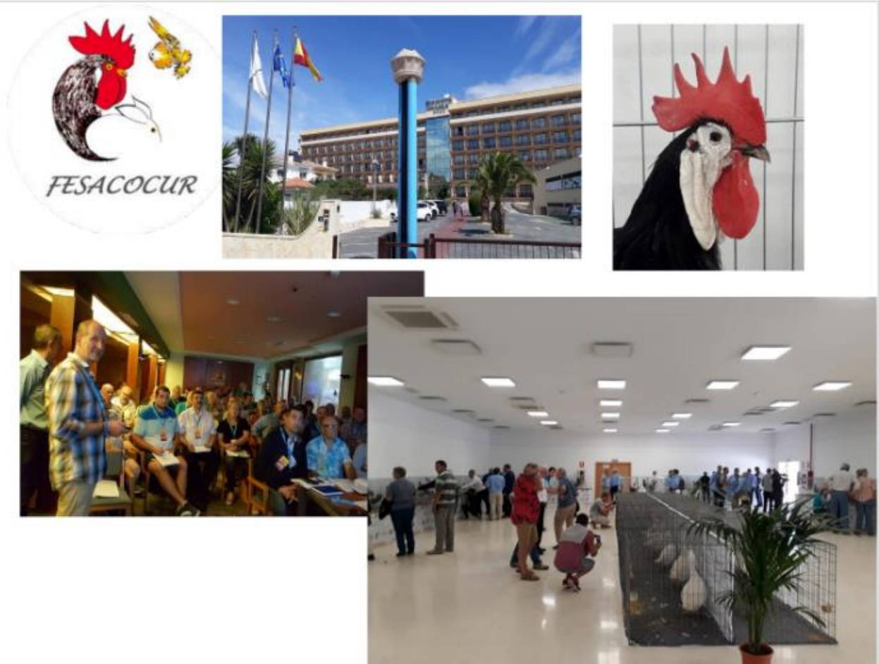
La réunion des juges européens à Mijas en Espagne, en septembre 2019

Cette réunion a été très bien organisée et était très intéressante, merci aux organisateurs espagnols.